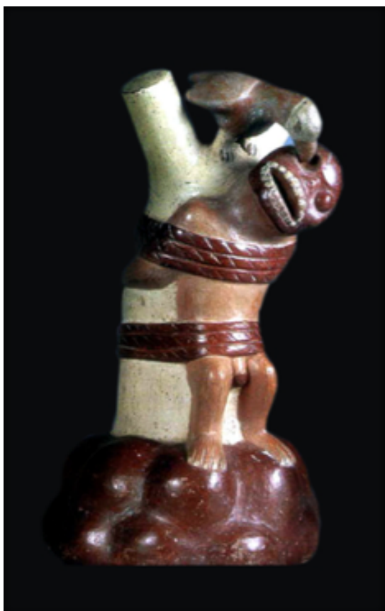
Escena de una herida punzocortante. Un ave de rapiña picotea el ojo de una persona atada a un poste, posiblemente víctima de castigo por adulterio. Cerámica Mochica, Museo Arqueológico Rafael Larco Herrera (MARLH).

los españoles con frecuencia hacían curar a sus heridos por los indios. El padre Acosta 10 , otro de los cronistas españoles, reconoce tal superioridad de los curanderos aborígenes cuando escribe: aún muchos años después de la conquista, los indios tenían por tales conocimientos a los médicos (españoles) de profesión.