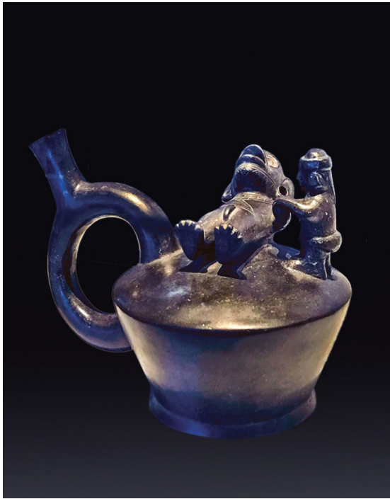
Cirujano realizando una reducción de hombro. Cerámica Chimú, MHM.