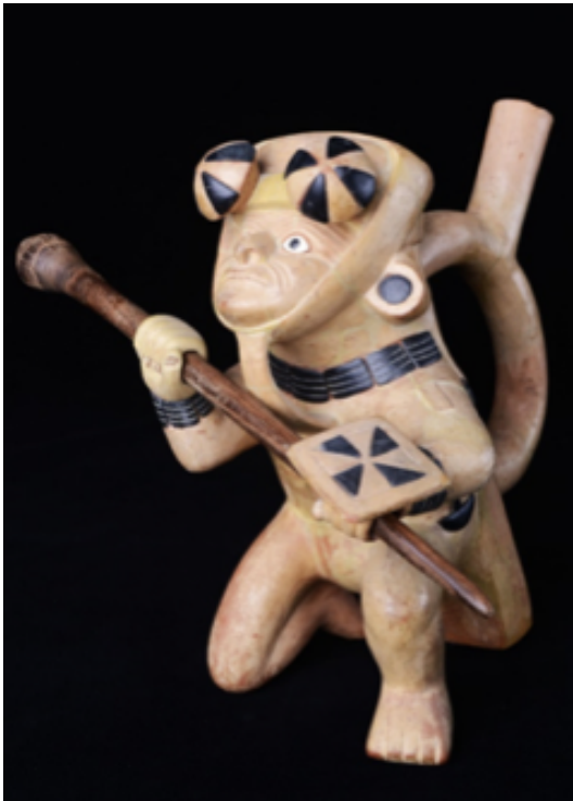
Guerrero con sus armas en actitud de alerta. Cerámica Mochica, Museo Huacas de Moche (MHM).

del contrincante. Eran confeccionadas de piedras o de bronce, de diferentes formas y tamaños, que por su naturaleza causaban lesiones graves.