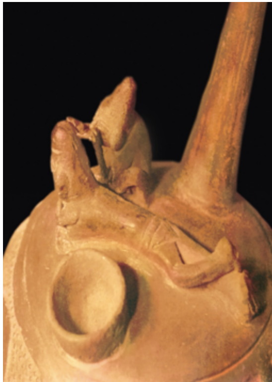
Cirujano suturando una herida del cuero cabelludo de un paciente. Cerámica Chimú, MNAAHP.