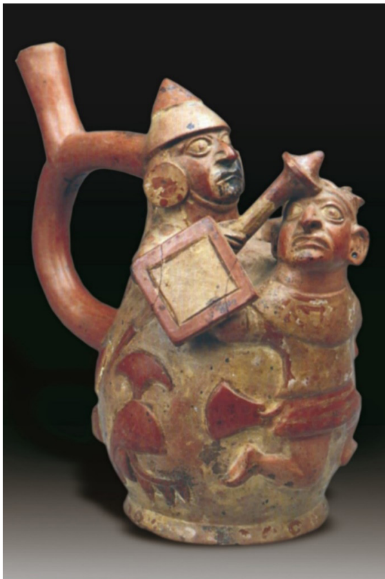
Escena de un traumatismo encéfalo craneano. Obsérvese que el guerrero con su porra impacta la región frontal de la cabeza de su enemigo. Cerámica Mochica, MNAAHP.

Las hondas eran armas muy efectivas para luchar a distancias largas. Los honderos fijaban su puntería hacia la cabeza del enemigo, logrando causar