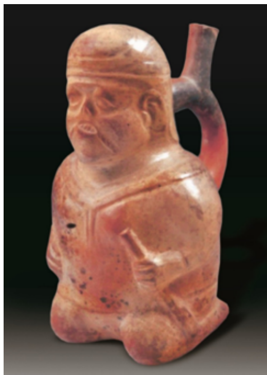
Hombre víctima de castigo a quien se le realizó sutura de una herida por desgarro en la boca. Obsérvese la buena cicatrización de la herida. Cerámica Mochica, MARLH.