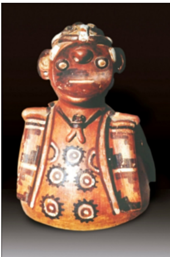
Individuo con la cabeza deformada, causada probablemente por traumatismos en la cara y en el cráneo. Cerámica Recuay, Museo de Arqueología, Antropología e Historia de la Universidad Nacional de Trujillo (MAAHUNT).

Eso no es todo, ya que los vencidos de guerra eran sometidos a graves torturas, y como consecuencia de estas quedaban mutilados, ciegos, mudos, quemados, etc., de cuya supervivencia se encargaba algún curandero de alma noble.