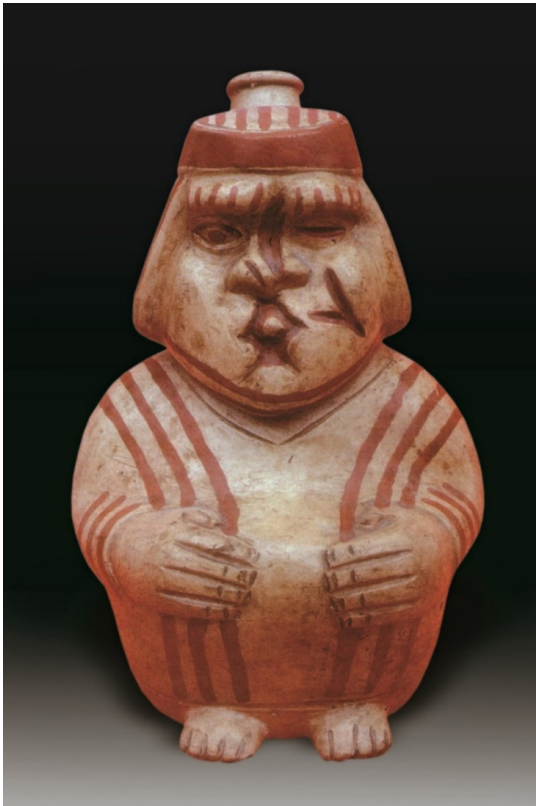
Varón con heridas cortantes en la cara y edema palpebral del ojo izquierdo, posiblemente víctima de castigo. Cerámica Mochica, MNAAHP.

de un árbol de gran virtud... la corteza reducida a polvo y puesta sobre cualquier herida, la limpia, la hace crecer, la cierra y la cura perfectamente.