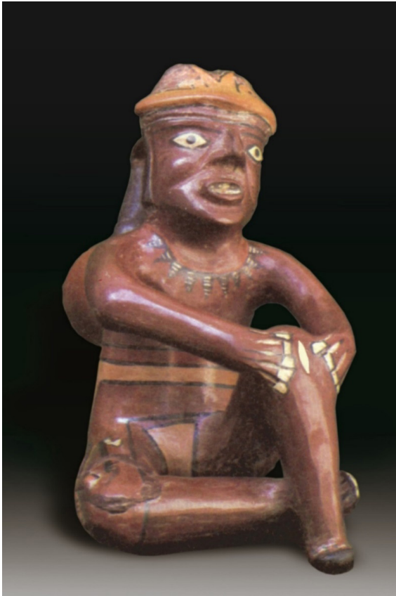
Guerrero nazca sentado muestra una herida cortante en su rodilla izquierda. Cerámica Nazca, MNAAHP.

antiguos aborígenes. Estos hechos socioculturales fueron muy arraigados en casi todas las civilizaciones antiguas en diferentes partes del mundo.