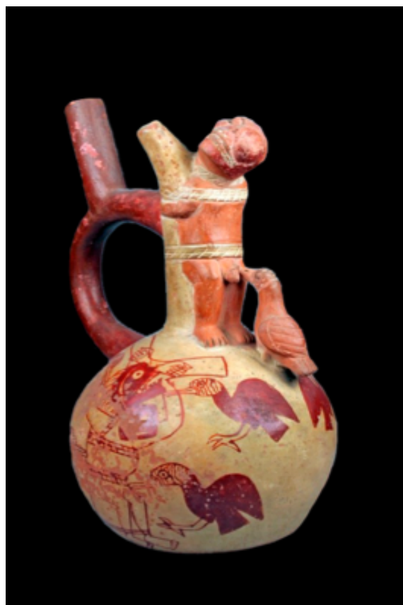
Escenas de heridas punzocortantes en víctimas de castigo. En la parte superior, un ave de rapiña picotea los genitales de un individuo que ya tiene los ojos lesionados por el ave. En la parte inferior, un ave de rapiña picotea la cara, y otro los genitales de un individuo. Cerámica Mochica, MNAAHP.

Para lavar las heridas emplearon infusión o cocimiento de hierbas como la Hinapaya o mata