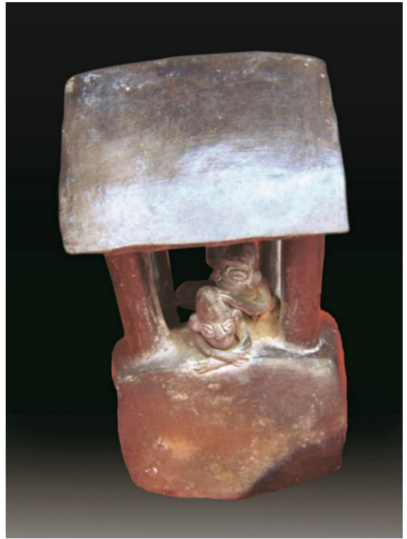
Escena de una intervención quirúrgica en la cabeza de un paciente producido por un traumatismo. Cerámica Chimú, MAC.