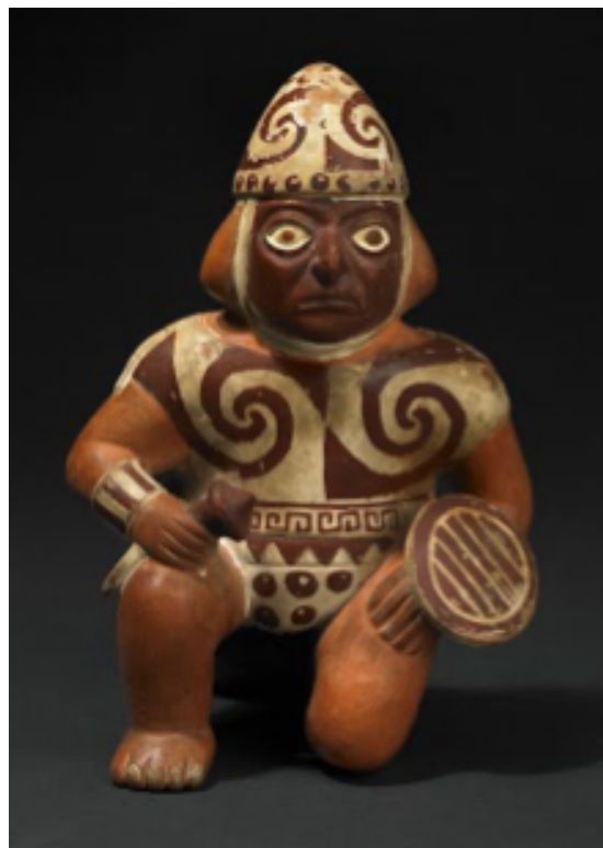
Guerrero con sus armas en actitud de alerta. Cerámica Mochica, Museo Etnológico de Berlín.

lesiones cerebrales y fracturas de cráneo, como la que sufrió Juan Pizarro, el hermano de Francisco, en el asalto de la fortaleza de Cusco, nos dice el doctor Cabieses. 6 Las hondas estaban confeccionadas de algodón o de lana y algunas veces de cordones de cuero o de tendones de llama. Los jefes militares y la nobleza usaban hondas muy lujosas adornadas con hilos de oro y plata. Como proyectiles usaban piedras ovaladas de ríos.