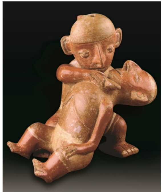
Escena de ejecución de una herida cortante. Obsérvese que una persona, con su cuchillo degüella a la otra, posiblemente por motivos rituales. Cerámica Vicús, Colección Enrico Poli.