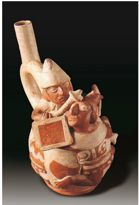
Escena de un traumatismo encéfalo craneano. Obsérvese que el guerrero impacta con su porra la región frontal de la cabeza de su enemigo. Cerámica Mochica, Museo Nacional de Arqueología, Antropología e Historia del Perú (MNAHP).

En mérito a lo mencionado se puede afirmar que la cerámica constituye una de las fuentes esenciales que permite reconstruir el pasado del sufrimiento de los antiguos indígenas ocasionado por los traumatismos. La cerámica pone en evidencia, de manera asombrosa y extraordinaria, lesiones producidas por traumatismos, que van desde una simple herida cortante en un miembro inferior hasta un grave traumatismo en la cabeza y, en algunos casos, los métodos o técnicas que han empleado para tratar los traumatismos.