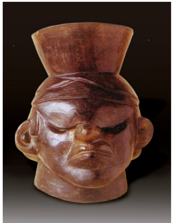
Rostro de un individuo con traumatismo facial. Observe la equimosis de los párpados inferiores (signo de mapache), el edema palpebral bilateral y la nariz deformada. Cerámica Mochica, MNAAHP.

Si bien es cierto que el arco y la flecha eran conocidos por los antiguos aborígenes, también es cierto que no eran muy populares en las culturas desarrolladas en la Sierra. La mayoría de las veces que se mencionan la flecha en la conquista, se refieren a dardos lanzados con la estófica. El arco y la flecha era un arma muy utilizada por las tribus de la selva amazónica. Tanto las flechas como los dardos, como las lanzas pequeñas eran envenenadas con diversas mezclas de hierbas y sustancias animales venenosa. 6