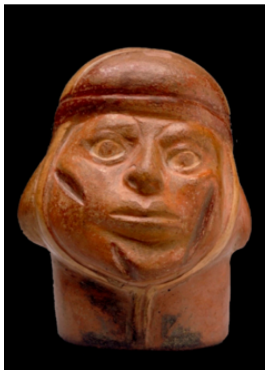
Rostro de un varón con hematomas o abscesos en la región parotídea bilateral cubierta por vendas, causadas por heridas cortantes. Cerámica Mochica, Museo Arqueológico Cassinelli.

Xerez (5) no solamente describe con precisión las armas que los aborígenes empleaban en las guerras sino que, por el orden que las describe, se deduce la estrategia de los ejércitos. En la primera fila de vanguardia se disponían los honderos que lanzaban miles de piedras de ríos. Luego, a medida que se iba estrechando las distancias, entraban sucesivamente en acción las lanzas, flechas. Finalmente, las hachas, cuchillos, porras o mazas. Con semejantes armas y con esa forma de pelear, los traumatismos debieron ser, indudablemente, muy frecuentes.