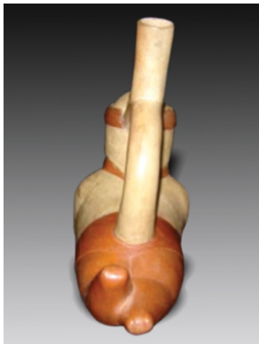
Individuo amputado de la parte distal de sus miembros inferiores. Obsérvese la sutura de la piel de los muñones. Obviamente el cirujano ha ligado los vasos sanguíneos para evitar la muerte por hemorragia. Cerámica Mochica, MAC.