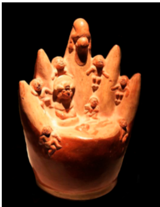
Escena de múltiples traumatismos. Obsérvese que las personas se arrojan de la cima de los cerros, posiblemente por sacrificios religiosos. Cerámica Mochica, MARLH.