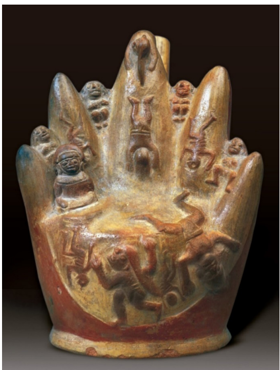
Escena de múltiples traumatismos. Obsérvese que las personas se arrojan de la cima de los cerros, posiblemente por sacrificios religiosos. Cerámica Mochica, MNAAHP.