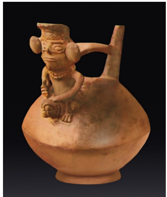
Escena de una trepanación craneana. El cirujano con la mano derecha empuña un cuchillo o tumi, el que está en contacto con el cráneo de una mujer, y con la mano izquierda inmoviliza la cabeza de la paciente. Cerámica Chimú, MNAAHP.